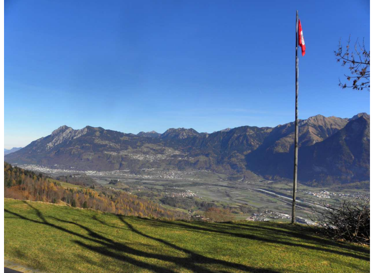
Blick ins Ländle