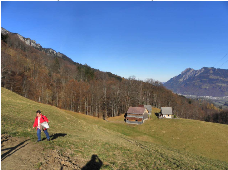
Esther beim Aufstieg mit Gesangs-Büchern und Pierino mit 11,7kg-Handorgel