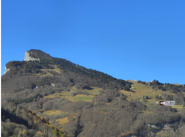
Skihaus Lanaberg 1075m ü.M. von Trübbach aus gesehen am 19. Nov. 2011